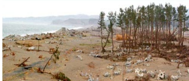
<被災した福島県の海岸防災林>

クロマツの苗木代等、海岸防災林再生に要する費用をくみずほが負担するとともに、グループ社員によるボランティアを派遣し、植栽活動、保育活動(下刈り、施肥、補植等)を行います。