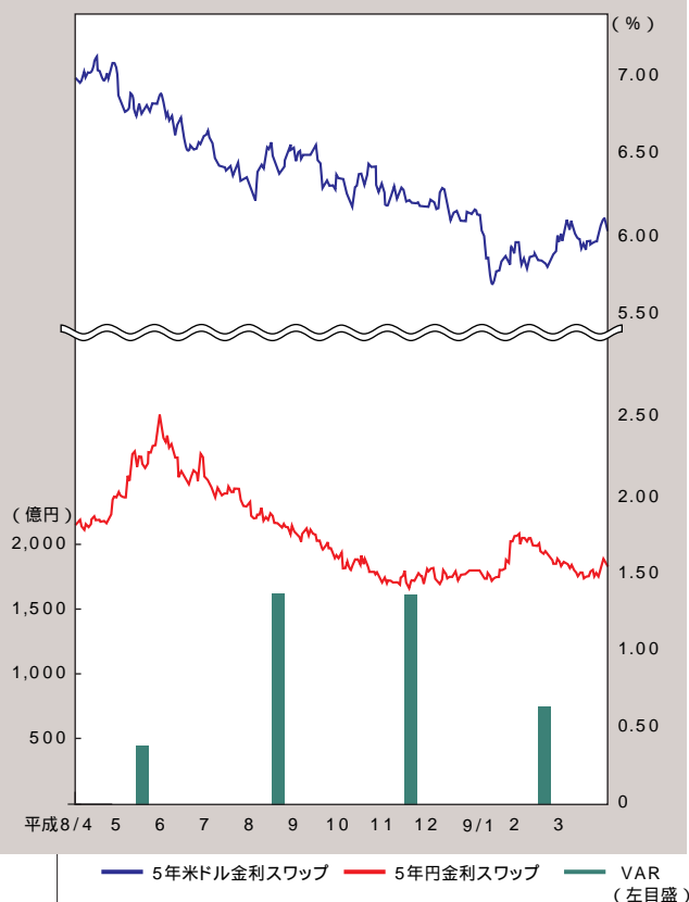
平成9年度の金利推移と四半期平均VARの推移

平成9年度の円金利動向を振り返りますと、長期金利は、4月から6月にかけて景気回復期待を反映し上昇致しましたが、7月以降は景気指標の悪化等を背景とした景況感の下振れ懸念から低下基調をたどりまし。年明けには、追加景気対策への期待から一旦金利は上昇しましたが、2月以降は再度低下基調となりました。一方で、米国金利は、落ち着いた物価動向、アジア通貨危機を契機とした米国債への資金流入等を背景に、年度を通じ低下基調をたどりまし。当行は、平成9年度に2,300億円を超える業務純益を実現しておりますが、市場動向に即応したALMオペレーションを実施したことも奏効し、平成10年3月末時点の公正価値は約3,800億円を確保致しまし（公正価値の定義は前ページ参照。なお、当該数字には、自己資本等でファンディングされている動産・不動産・株式等の評価、クレジットの相違による信用リスクの評価、並びに手数料等の役務収益は含まれておりません）。