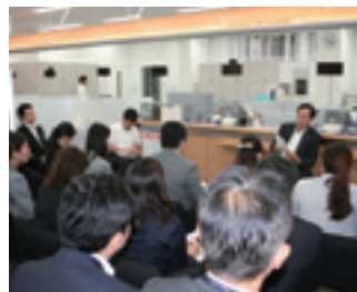
「役員懇談会」の様子

銀行・信託・証券の国内外全部拠点で、役員との意見交換を目的とした「役員懇談会」を実施し、役職員間の一体感やビジョン実現に向けた参加者一人ひとりの当事者意識の醸成につなげています。