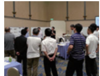
「部店長オフサイト」の様子

銀行・信託・証券の国内外全部拠点長を対象としたオフサイトミーティング「部店長オフサイト」を継続的に実施しており、平成25年度・平成26年度合計で1,251名が参加しました。グループ横断での自由闊達な議論を通じて、各部拠点長がビジョンの実現に向けた想いを共有し、グループとしての一体感、侃侃諤々の議論を行う企業風土の醸成につながっています。