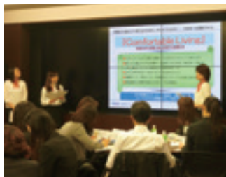
担当役員への提言発表会の様子

また、営業部店と本部のメンバーと一緒に議論を交わしながらサービス向上に取り組む「サービス提供力No.1ラボ活動」を推進しています。平成26年度は8つのテーマに総勢74名の社員が参加し、各テーマごとに提言を取りまとめました。