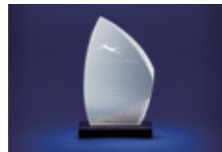
「One MIZUHOカルチャープライズ」トロフィー