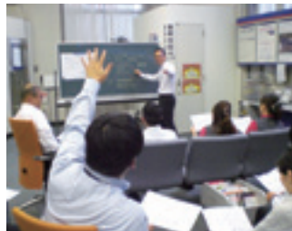
「One MIZUHO DAY」の様子

『くみずほ』の企業理念』に掲げるビジョンは、一人ひとりの想いや行動を重ね合わせ、役職員全員で実現していくものとの考え方のもと、銀行・信託・証券の国内外全部拠点が、部拠点長と職員の対話を通じた「目指すべき姿」(自部店ビジョン)を策定し、その実現に向けた部拠点ごとの取り組みを実践しています。また、前年度の振り返りと今年度の取り組みについて議論する「One MIZUHO DAY」を全部拠点で開催しました。これらの取り組みの結果、「積極的に支店を良くしていこうという気持ちになれた」等の声があがる等主体性の向上につながっています。