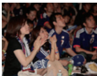
「日本代表サッカー観戦イベント」の様子

グループ一体感醸成の観点からグループ合同での「日本代表サッカー観戦イベント」や地域・拠点ごとに社会貢献活動を行う「みずほボランティアデー」等のイベントを実施しています。「日本代表サッカー観戦イベント」には、グループ各社から約3,100名の役職員が参加しました。