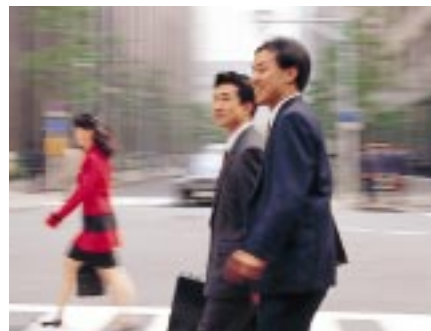
当行公募公社債引受・受託状況(平成10年度発行分)

また、国際機関や外国政府・政府機関が発行する多くの円建外債の代表受託銀行・債券の管理会社としても豊富な実績を有しております。